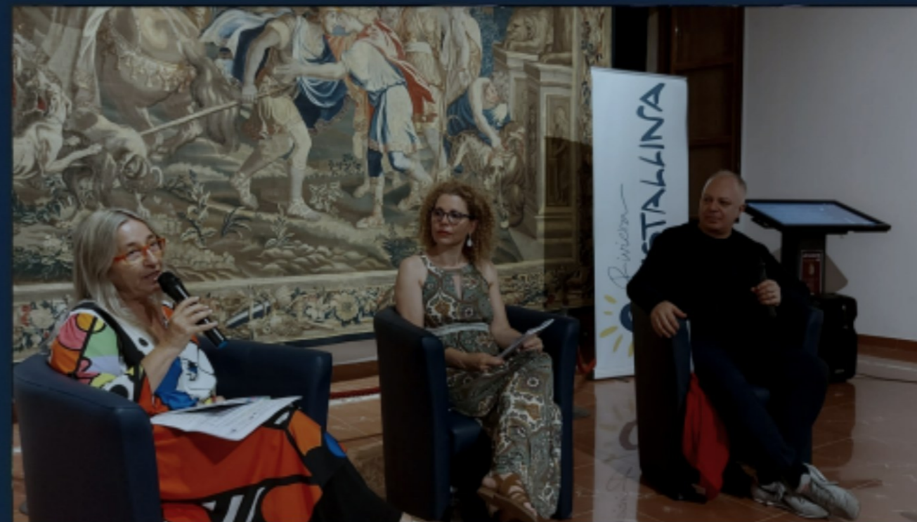
Dialoghi, teatro, comunità e territorio