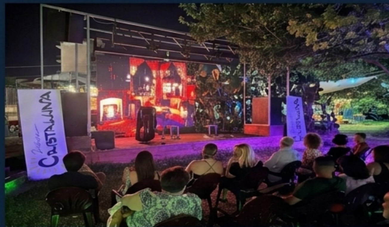
Il pensiero entra nei luoghi